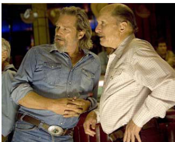
2009 CRAZY HEART (Crazy Heart) de Scott Cooper avec Jeff Bridges