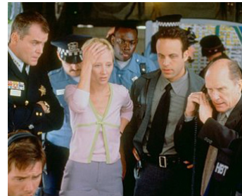
2002 JOHN Q (John Q) de Nick Cassavetes avec Ray Liotta, Anne Heche, David Thornton