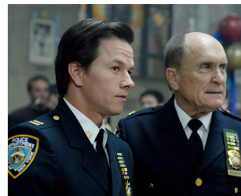
2007 LA NUIT NOUS APPARTIENT (We own the Night) de James Gray avec Mark Wahlberg