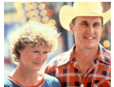
1984 THE STONE BOY (The Stone Boy) de Christopher Cain avec Glenn Close