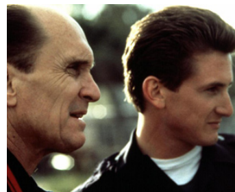
1988 COLORS (Colors) de Dennis Hopper avec Sean Penn