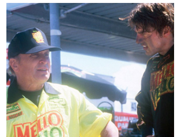
1990 JOURS DE TONNERRE (Days of Thunder) de Tony Scott avec Tom Cruise