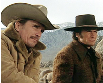
1972 JOE KIDD (Joe Kidd) de John Sturges avec Clint Eastwood