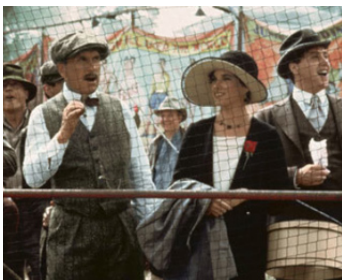
1984 LE MEILLEUR (The Natural) de Barry Levinson avec Barbara Hershey