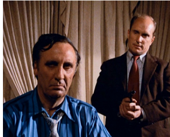
1973 ÉCHEC À L'ORGANISATION (The Outfit) de John Flynn avec Timothy Carey