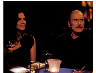
2002 ASSASSINATION TANGO de Robert Duvall avec Lucia Pedraza