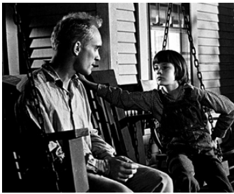
1962 DU SILENCE ET DES OMBRES (To kill a Mockingbird) de R. Mulligan avec Mary Badham