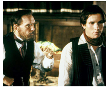
1992 NEWSIES (Newsies, the new boys) de Kenny Ortega avec Christian Bale