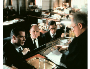
1998 PRÉJUDICE (A Civil Action) de Mimi Leder avec John Travolta, Zeljko Ivanek, J. Lithgow