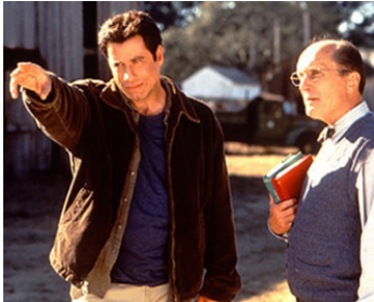
1996 PHÉNOMÈNE (Phenomenon) de Jon Turteltaub avec John Travolta