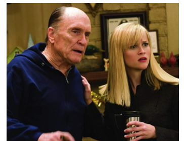
2008 TOUT... SAUF EN FAMILLE (Four Christmases) de Seth Gordon avec Reese Witherspoon