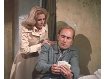
1975 L'ÉVADÉ (Breakout) de Tom Gries avec Jill Ireland