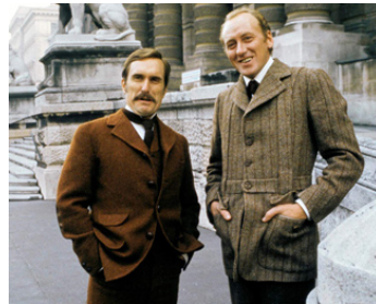
1976 SHERLOCK HOLMES ATTAQUE L'ORIENT EXPRESS d'H. Ross avec Nicol Williamson