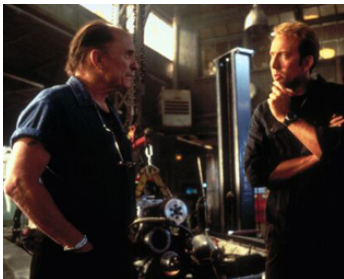
2000 60 SECONDES CHRONO (Gone in Sixty Seconds) de Dominic Sena avec Nicolas Cage