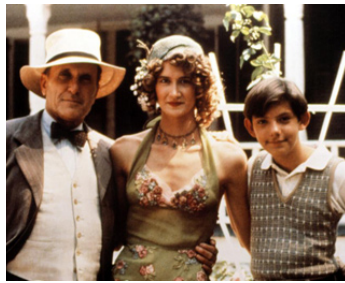
1991 RAMBLING ROSE de Martha Coolidge avec Laura Dern, Lukas Haas