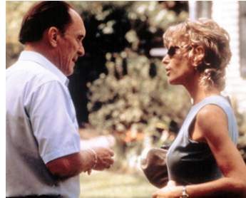
1997 LE PRÉDICATEUR (The Apostle) de Robert Duvall avec Farrah Fawcett