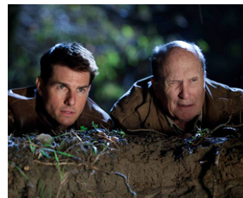
2012 JACK REACHER (Jack Reacher) de Christopher McQuarrie avec Tom Cruise