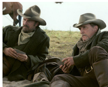
2003 OPEN RANGE (Open Range) de et avec Kevin Costner