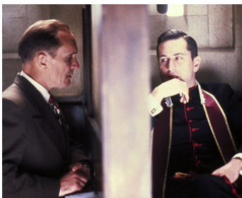
1981 SANGLANTE CONFESSIONS (True Confessions) d'Ulu Grosbard avec Robert De Niro