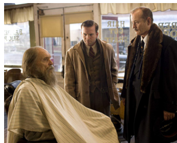
2010 LE GRAND JOUR (Get Low) d'Aaron Schneider avec Lucas Black, Bill Murray