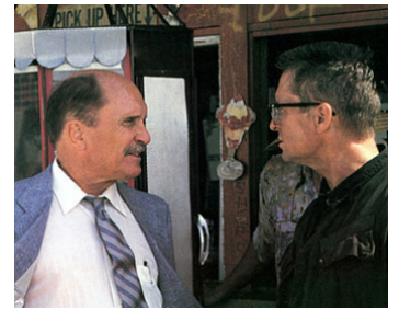
1993 CHUTE LIBRE (Falling Down) de Joel Schumacher avec Michael Douglas