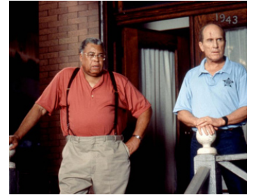
1996 LA COULEUR DU DESTIN (A Family Thing) de Richard Pearce avec James Earl Jones