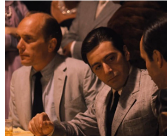
1974 LE PARRAIN 2 (The Godfather, part 2) de F. F. Coppola avec Al Pacino, John Cazale