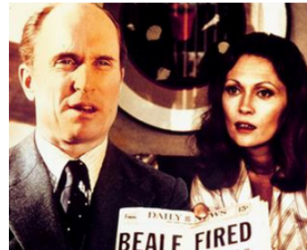
1976 MAIN BASSE SUR LA TV (Network) de Sidney Lumet avec Faye Dunaway