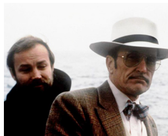
1985 LE BATEAU-PHARE (The Lightship) de Jerzy Skolimowski avec Klaus-Maria Brandauer