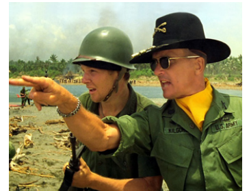
1979 APOCALYPSE NOW (Apocalypse Now) de Francis Ford Coppola avec Sam Bottoms