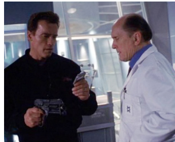
2000 À L'AUBE DU 6 e JOUR (The 6th Day) de Roger Spottiswoode avec Arnold Schwarzenegger