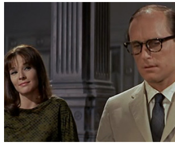
1966 LA POURSUITE IMPITOYABLE (The Chase) d'Arthur Penn avec Janice Rule