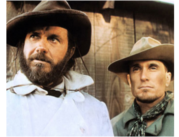
1972 LA LÉGENDE DE JESSE JAMES (The great Northfield...) de P. Kaufman avec C. Robertson