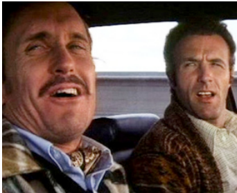
1975 TUEUR D'ÉLITE (The Killer Elite) de Sam Peckinpah avec James Caan