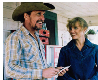
1983 TENDRE BONHEUR (Tender Mercies) de Bruce Beresford avec Tess Harper