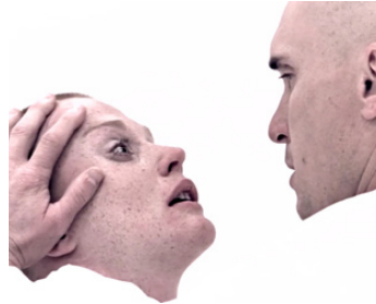
1972 THX 1138 (THX 1138) de George Lucas avec Maggie McOmie