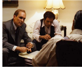
1972 LE PARRAIN (The Godfather) de Francis Ford Coppola avec James Caan, Marlon Brando