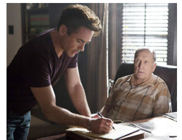
2014 LE JUGE (The Judge) de David Dobkin avec Robert Downey Jr