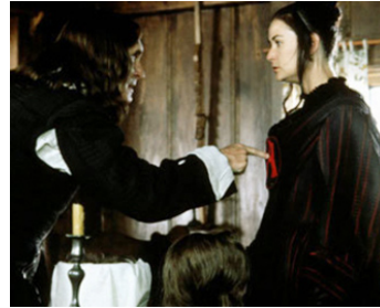
1995 LES AMANTS DU NOUVEAU MONDE (The Scarlet Letter) de Roland Joffé avec Demi Moore