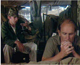
1970 M.A.S.H. (M.A.S.H.) de Robert Altman avec Donald Sutherland