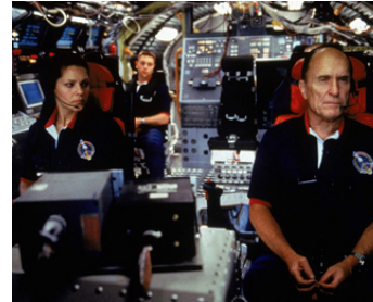
1998 DEEP IMPACT (Deep impact) de Mimi Leder avec Mary McCormack, Ron Eldard