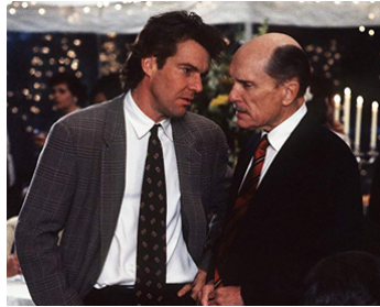
1995 AMOUR ET MENSONGES (Something to talk about) de L. Hallström avec Dennis Quaid