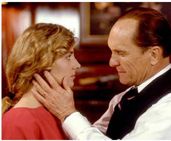
1990 LA SERVANTE ÉCARLATE (The Handmaid's Tale) de V. Schlöndorff avec Natasha Richardson